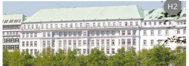
Fairmont Hotel Vier Jahreszeiten (5 min mit Taxi) Neuer Jungfernstieg 9-14, 20354 Hamburg +49 (0) 040-34940 www.hvj.de