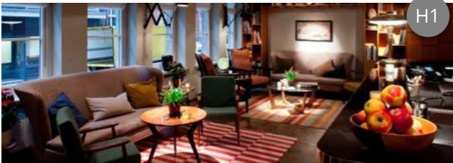
HENRI Hotel (5 min zu Fuß) Bugenhagenstraße 21, 20095 Hamburg +49 (0) 40 - 554357557 www.henri-hotel.com