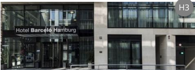
Barceló Hamburg (5 min zu Fuß) Ferdinandstraße 15, 20095 Hamburg +49 (0) 40 - 2263620 www.barcelo.com